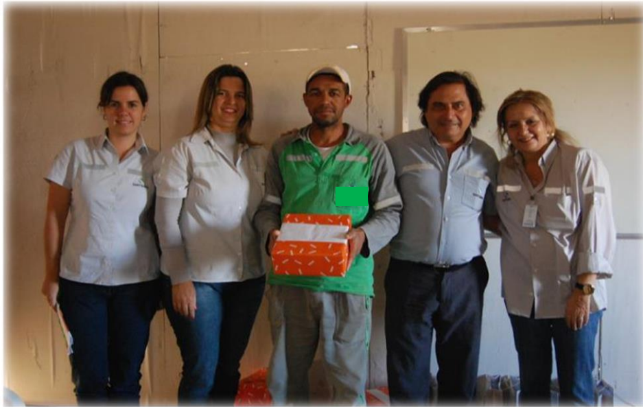
Os colaboradores recebem brindes .