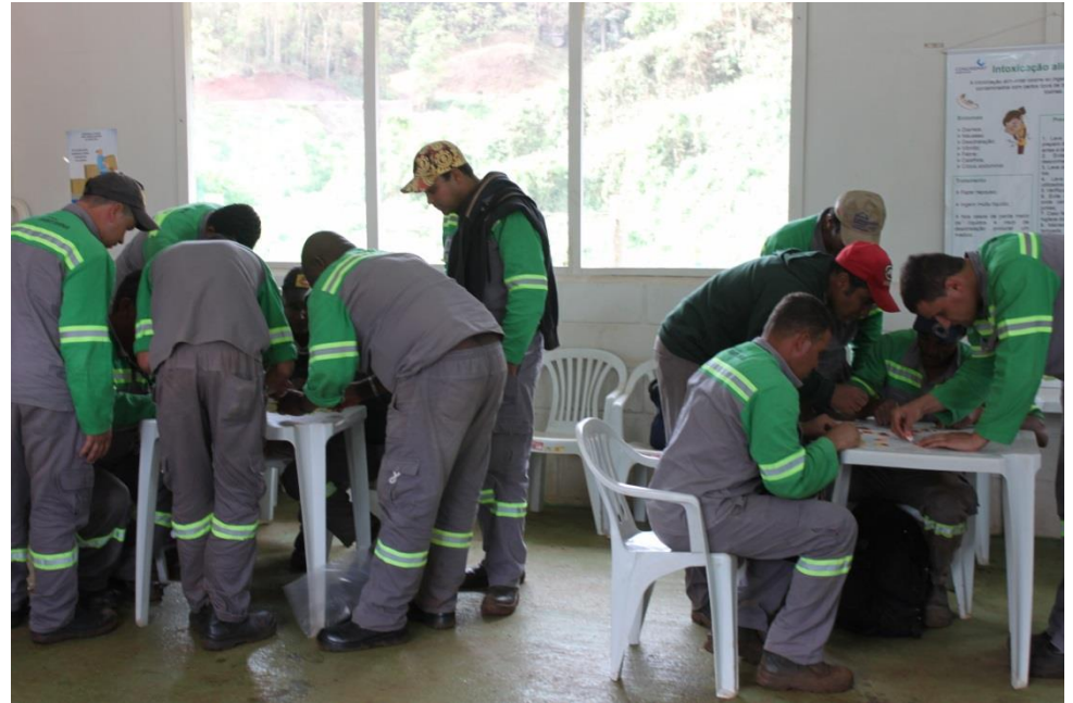
Dinâmica com a montagem de quebra cabeças com temas relacionados a SSO